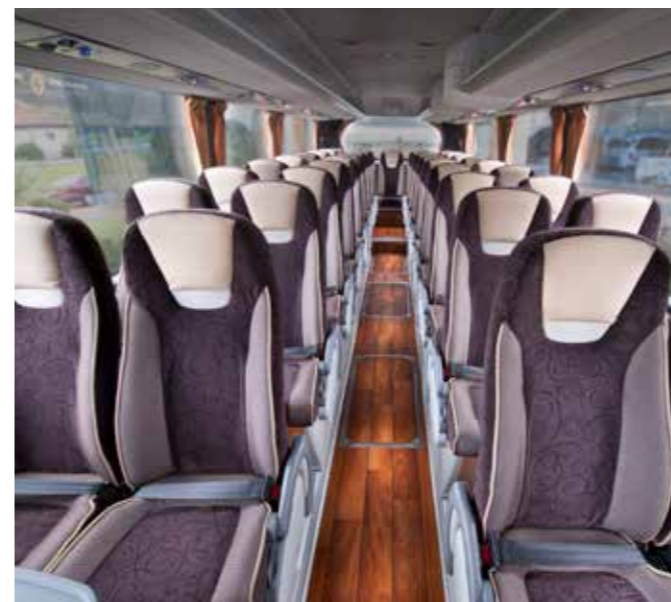
כיסאות מרווחים הניתנים להתאמה אישית