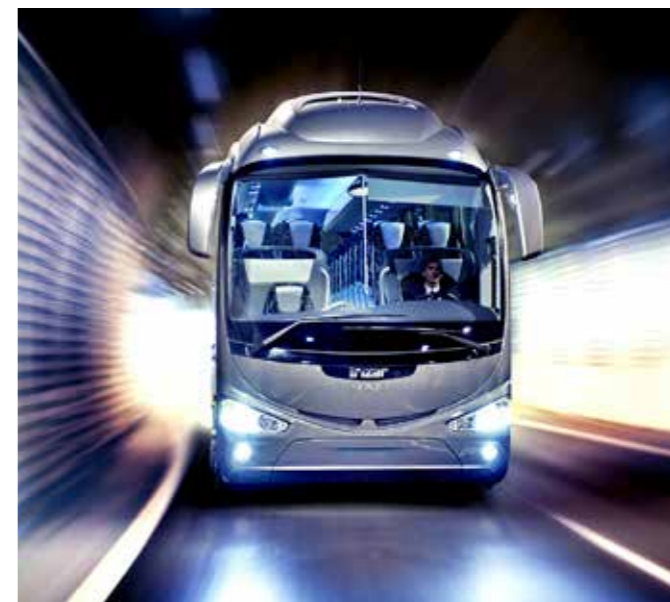
עיצוב חדשני ואלגנטי