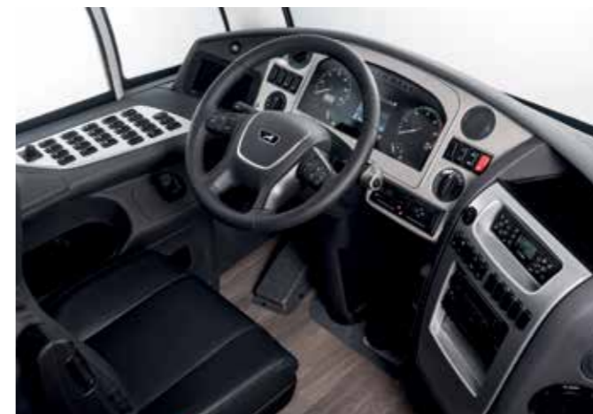
סביבת נהג ארגומטרית