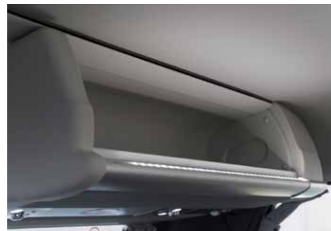
תאי אחסון לנוסעים