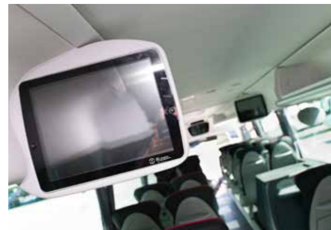
טכנולוגיה מתקדמת (במסך)